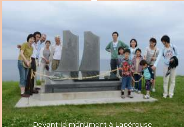
Devant le monument à Lapérouse