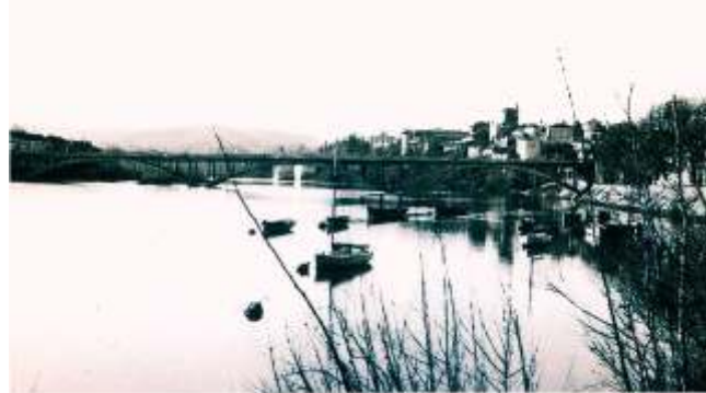
Plan d'eau sur le Lot à Clairac avec embarcations de l'école navale

Un petit noyau de gardiennage de l'Ecole reste à Clairac, mais tous les élèves officiers et leurs cadres effectuent une marche silencieuse de 35 km. dans la nuit du 14 août 1944, marche comprenant des détours, éprouvante avec le paquetage mais qui se passe sans incident. Les deux points critiques sont de franchir, par un détour dans l'ouest de Tonneins, à Fauguerolles la grande voie ferrée, en principe assez sérieusement surveillée, puis faire une traversée discrète de la Garonne, au Mas d'Agenais. Peu après la jonction est faite avec le maquis de Nérac, qui fournit quelques véhicules. Le lieu de rassemblement est proche d'Andiran, puis au château de Lisse, à une dizaine de Km. au Sud-Ouest de Nérac, à la lisière de la forêt des Landes. Les maquisards du nord de la Garonne guident quelques égarés ou trainards, ramassent les objets de paquetage abandonnés et occultent les traces de passage de ce groupe important. Le maire de Clairac, qui sait évidemment la vérité, rend compte au Préfet d'Agen qu'on lui a rapporté que l'Ecole était partie au Nord, sans avoir pu le vérifier... Mais fin août les Allemands, après remontée de leurs contingents du Béarn et du Gers, abandonnent progressivement le contrôle de la vallée de la Garonne pour se joindre à des combats plus urgents pour eux.