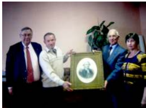
De g à d: M. Priet, M. Le maire, M. Bodin, Mme l'adjointe au maire

Il est convenu de confier la conduite locale de la construction à notre hôte ; celui-ci consultera l'institut des Beaux-Arts de Khabarovsk et formulera des propositions à l'Association d'Albi. Ceci n'exclut pas que l'Association fasse également des propositions. Deux tendances sont possibles selon que l'on envisage un monument conforme à la tradition russe (à partir d'un bloc de roche) ou bien entièrement fabriqué. Par ailleurs, l'Association fournira un bas-relief de La Pérouse et une plaque explicative bilingue. L'emplacement prévu pour y édifier le monument paraît excellent, car, comme la Capitainerie, il sera bien visible à partir de la rade et de la route côtière. Celle-ci, dans l'agglomération relie le port de De-Kastri, principalement exportateur de bois, au terminal pétrolier situé une dizaine de kilomètres plus au Nord. On peut penser que le trafic routier et le