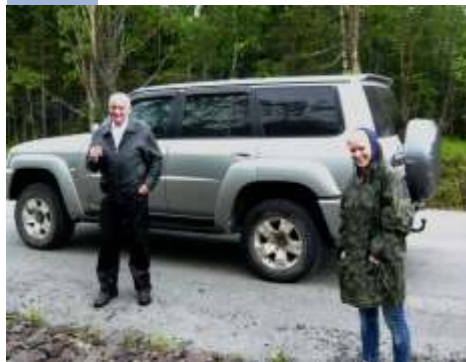
Notre hôte et la Directrice adjointe faisant fonction d'interprète

Conservé et mettre en valeur le patrimoine de notre nation, qu'il soit matériel (exemple : un monument) ou non (exemple : une œuvre littéraire), est un devoir qui nous incombe ; c'est un héritage lié à l'histoire de notre pays qu'il convient de transmettre intact, voire amélioré, aux générations futures. A notre époque, le développement des moyens de communication et de transports fait qu'il est particulièrement important de se « manifester » lorsque ce patrimoine - créé à partir de l'Hexagone - est constitué par des terres lointaines (exemple : îles Kerguelen) ou par le potentiel encore inexploité de nos espaces marins. Il en est de même pour certains points géographiques remarquables (baie, cap, sommet, etc) : ce ne sont pas des entités territoriales appartenant à la France, mais leur nom a été attribué par un découvreur français et illustre à la fois l'auteur d'un tel « toponyme » et le personnage qui est honoré par son intermédiaire (généralement un homme d'envergure nationale ou un membre méritant de l'équipage du découvreur). Ainsi, au cours de son voyage de découverte, La Pérouse attribue de nombreux toponymes : lorsqu'à travers les siècles ceux-ci ont été conservés, il nous revient aujourd'hui d'en assurer la sauvegarde et le rayonnement.